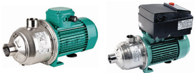
MHI / MHIE