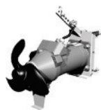
MISTURADOR DE ALTA VELOCIDADE